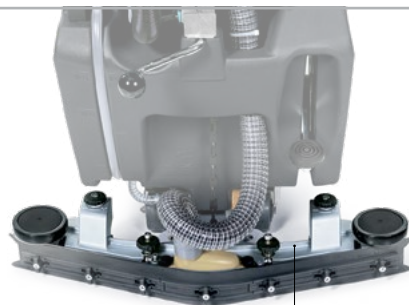
SUPPORT SUCEUR ANTI-CORROSION

Le support du suceur est tout aluminium, c'est qui le rend solide et antichoc. Il est également spécialement traité pour être anticorrosion. La MMx B/Bt peut ainsi être utilisée dans des environnements tels que les piscines ou les fromageries, où elle offre des prestations et des rendements élevés.